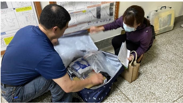
說明：毒化物聯防 B02203 組支援器材設備