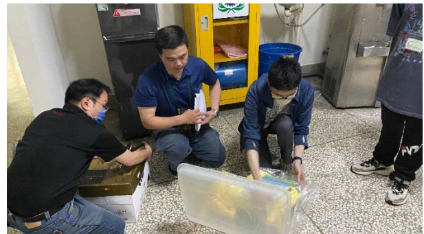
說明：毒化物聯防 B02203 組支援器材設備