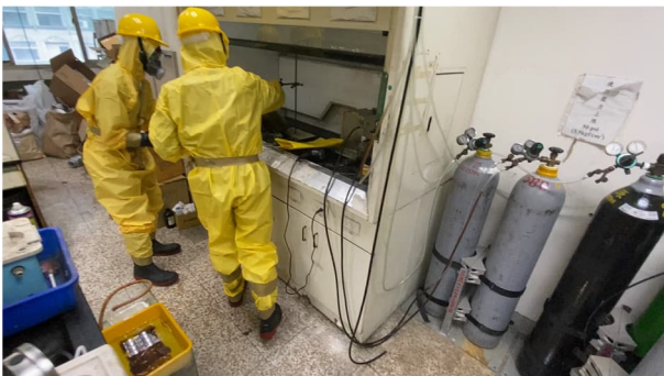
說明：使用應變器材進行環境清污作業