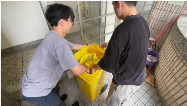
說明：人員進行清污作業