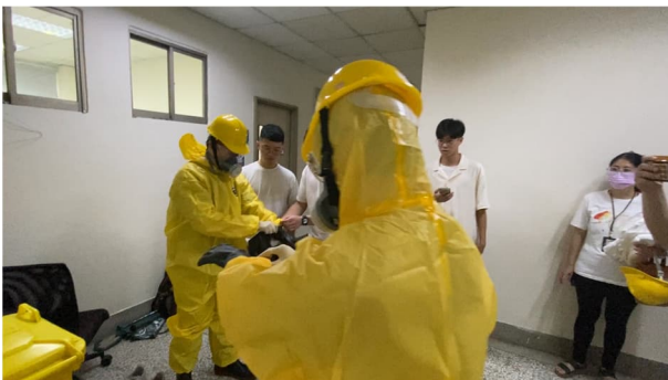
說明：人員穿戴個人防護具