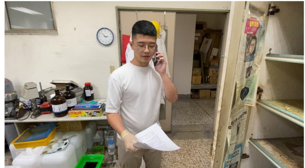
說明：通報校內相關單位並請求支援