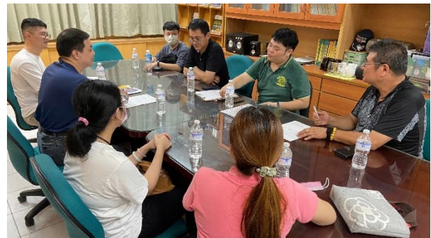
說明：檢討改善會議