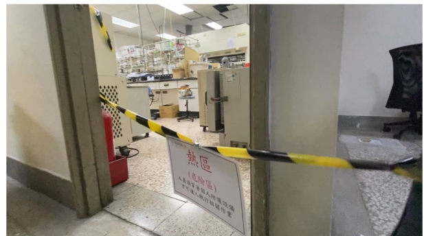
說明：劃分熱區、暖區、冷區