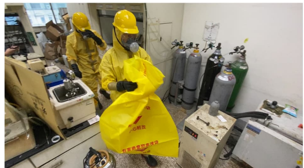
說明：以有害事業廢棄物袋進行收集作業