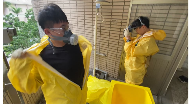
說明：脫除個人防護具並置入廢棄物收集桶