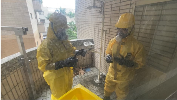
說明：人員進行清污作業